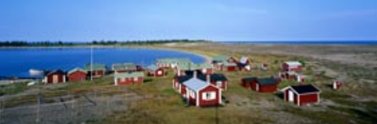
Stenskärs fiskeläge.