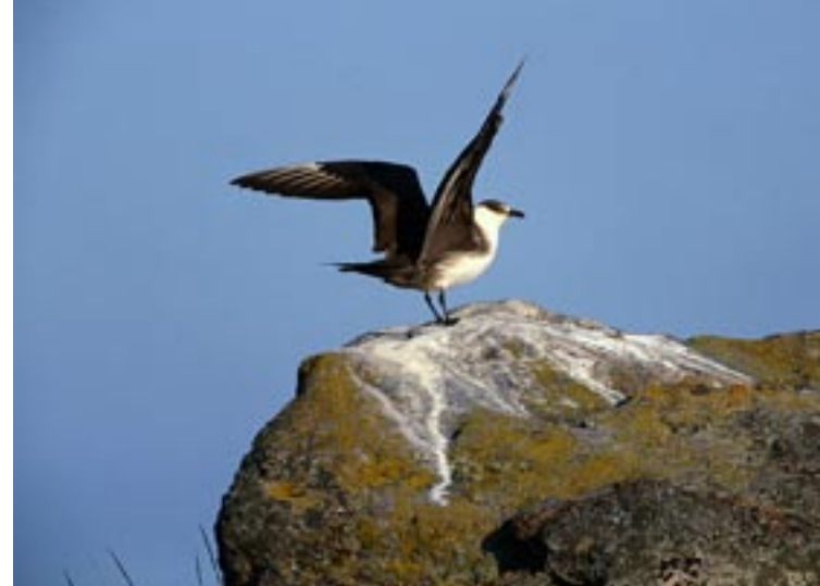
Labb. De flesta fågelarter på öarna är markhäckare och utsätts lätt för störning. Ser du oroliga fåglar är risken stor att du är nära ägg eller ungar. Gör en omväg för att inte störa.

Fornlämningar är skyddade enligt kulturminneslagen och får ej skadas. Vidare finns ett allmänt förbud mot att köra med motordrivna fordon i terräng på samtliga öar och holmar i Norrbottens skärgård (gäller även snöskoter). Stugägare har dock rätt att färdas närmaste väg från strand till egen stuga.